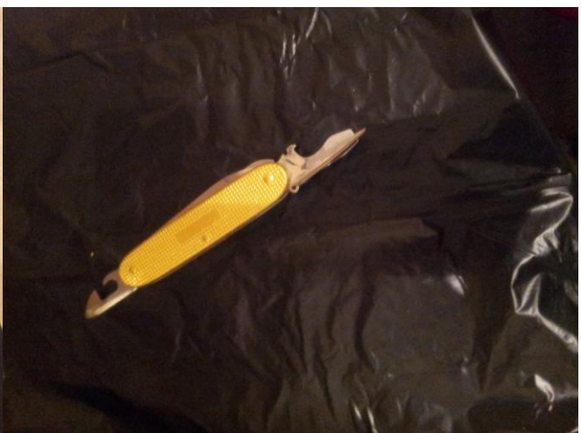
2. & 3. Schicht Acryl Mixio und Blattgold. Anschliessend noch poliert und ausgepackt.