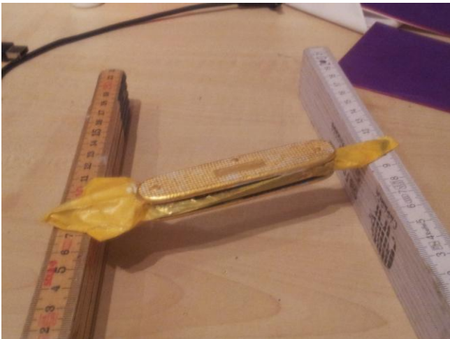
Auftragen von Acryl Mixio und erste Schicht Rosenobel Doppelgold 23 3/4 Karat